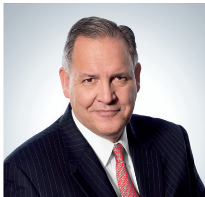
Presidente ed Amministratore Delegato

In United Technologies, siamo uniti dai nostri valori fondamentali. Questi valori ci impongono di agire con integrità e di trattare ciascun dipendente, cliente e fornitore con fiducia e rispetto. Agire con integrità significa anche rispettare qualsiasi legge, norma e regolamento. Quest'anno, stiamo lanciando nuovamente il Codice di condotta di UTC al fine di concentrarci sui valori alla base della nostra cultura: fiducia, integrità, rispetto, innovazione ed eccellenza.